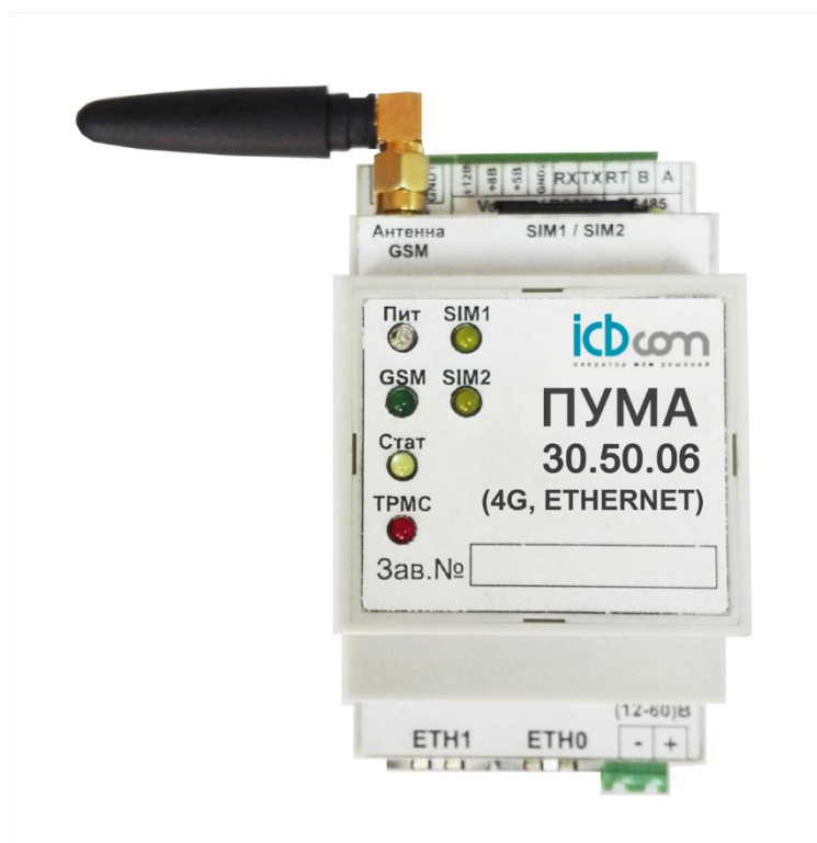
Рисунок 1 - Внешний вид контроллера

Внешний вид контроллера представлен на рис.1.