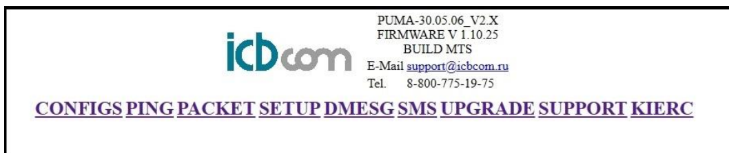
Рисунок 2 – Форма загрузки Web-интерфейса